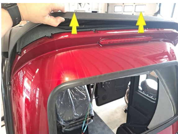
Nosta kattoa takaosasta ja ota takapaneelin yläosa pois välistä.