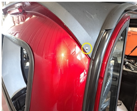
Irrota kuvassa näkyvät kiinnitysruuvit (ristipäämeisseli ph2) kummaltakin puolelta.