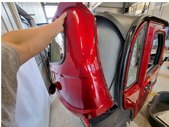
Nosta takapaneeli pois.