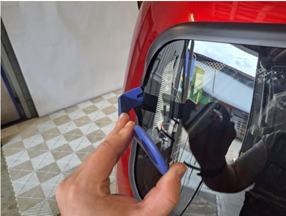
Raota takalasin tiivistettä. (muovinen sorkkarauta).