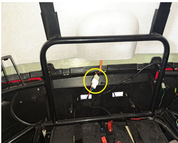
Avaa latauspistokkeen liitin.