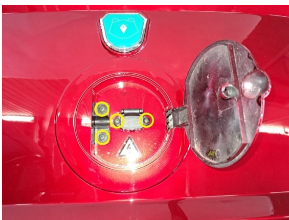
Irrota kuvassa näkyvät latausluukun lukitus ja latausportin kiinnitysruuvit. (ristipäämeisseli ph2). Ota ne pois.