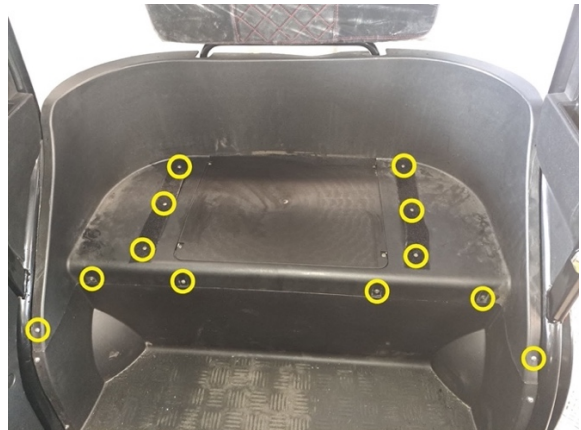
Irrota kuvassa näkyvät kiinnitysruuvit (ristipäämeisseli ph2) ja irrota Velcro- tarranauhat.