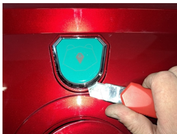
Irrota logo pois.