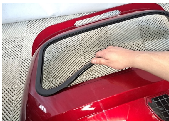
Irrota takalasin tiiviste.