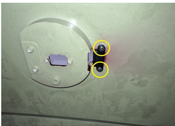
Irrota kuvassa näkyvät latausluukun kiinnitysruuvit (ristipäämeisseli ph2). Ota latausluukku irti.