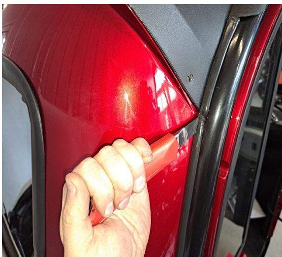
Leikkaa katon takaosan ja takapaneelin liimasaumat auki kummaltakin puolelta. (katkoteräveitsi)