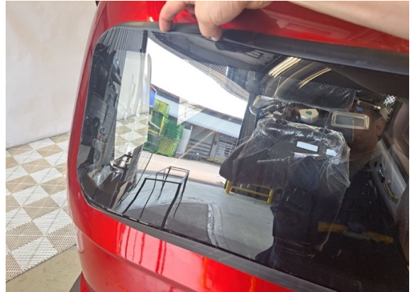
Irrota takaikkuna pois tiivisteestä.